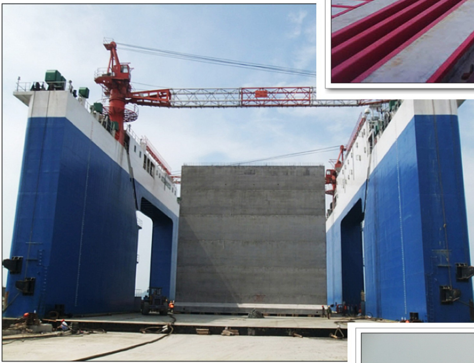
▶ 厦门港招银10号泊位大型沉箱上驳