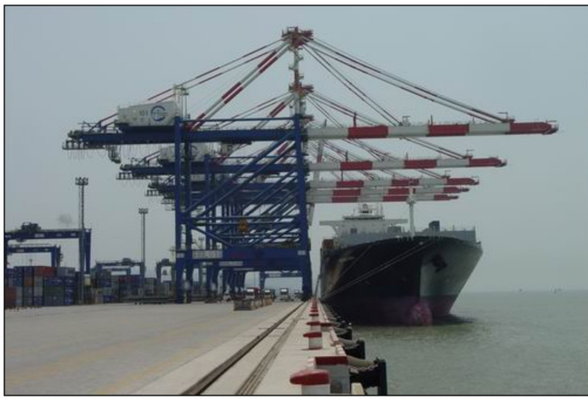
▲ 嵩屿港区一期1#泊位工程