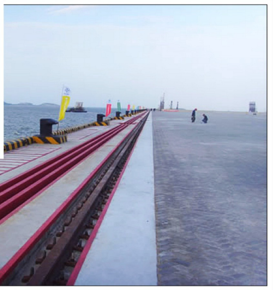
▲ 泉州港石湖作业区4#泊位工程