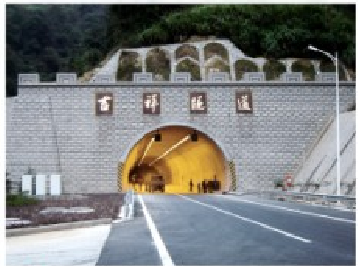
▲ 福建南平吉祥隧道