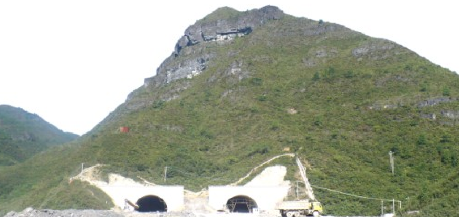
贵都高速公路贾托坡隧道