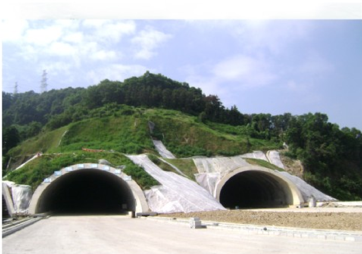
施工中的广东深圳丹平快速路猫公坝隧道