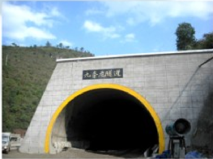
▲ 贵都高速公路九条龙隧道