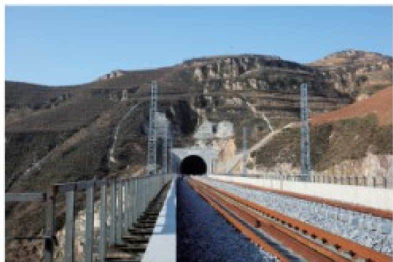
▲ 太中银铁路下白霜1号隧道