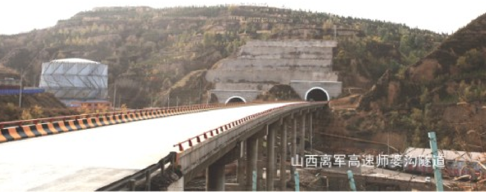
山西离军高速师婆沟隧道