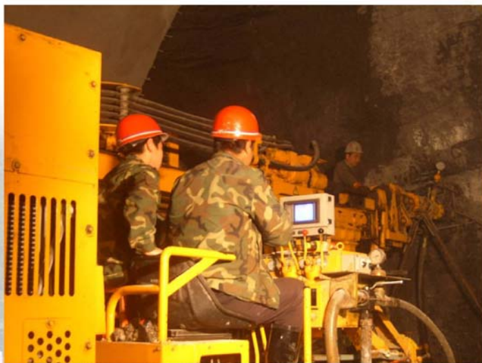
▲ 隧道施工特种超前水平钻