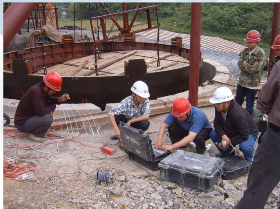
▲ 竖井TSP超前地质预报