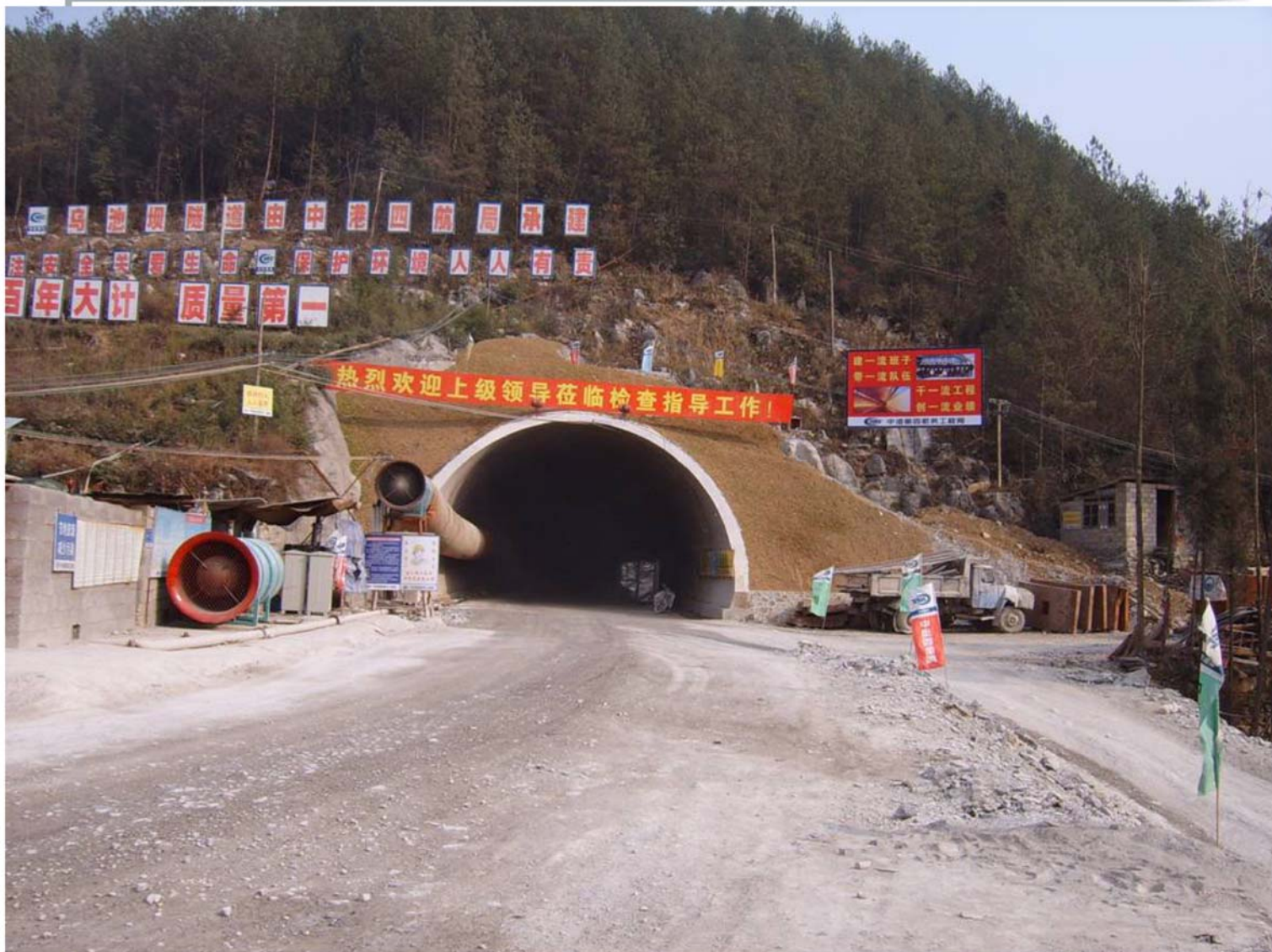
乌池坝特长隧道左洞隧道削竹式洞门