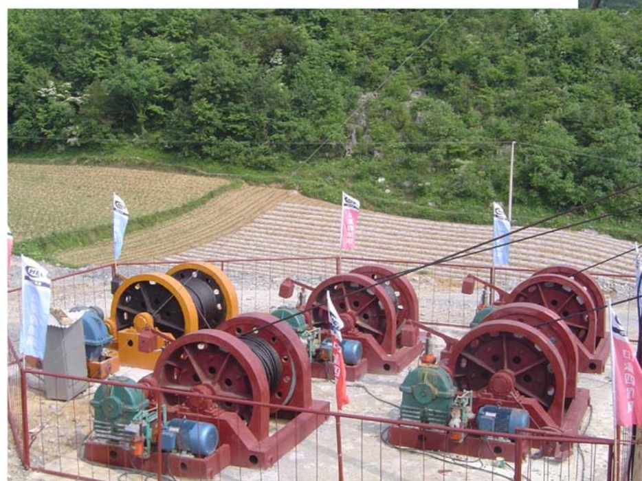
▲ 竖井施工悬吊稳车