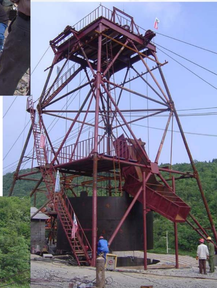
▲ 竖井施工凿井井架