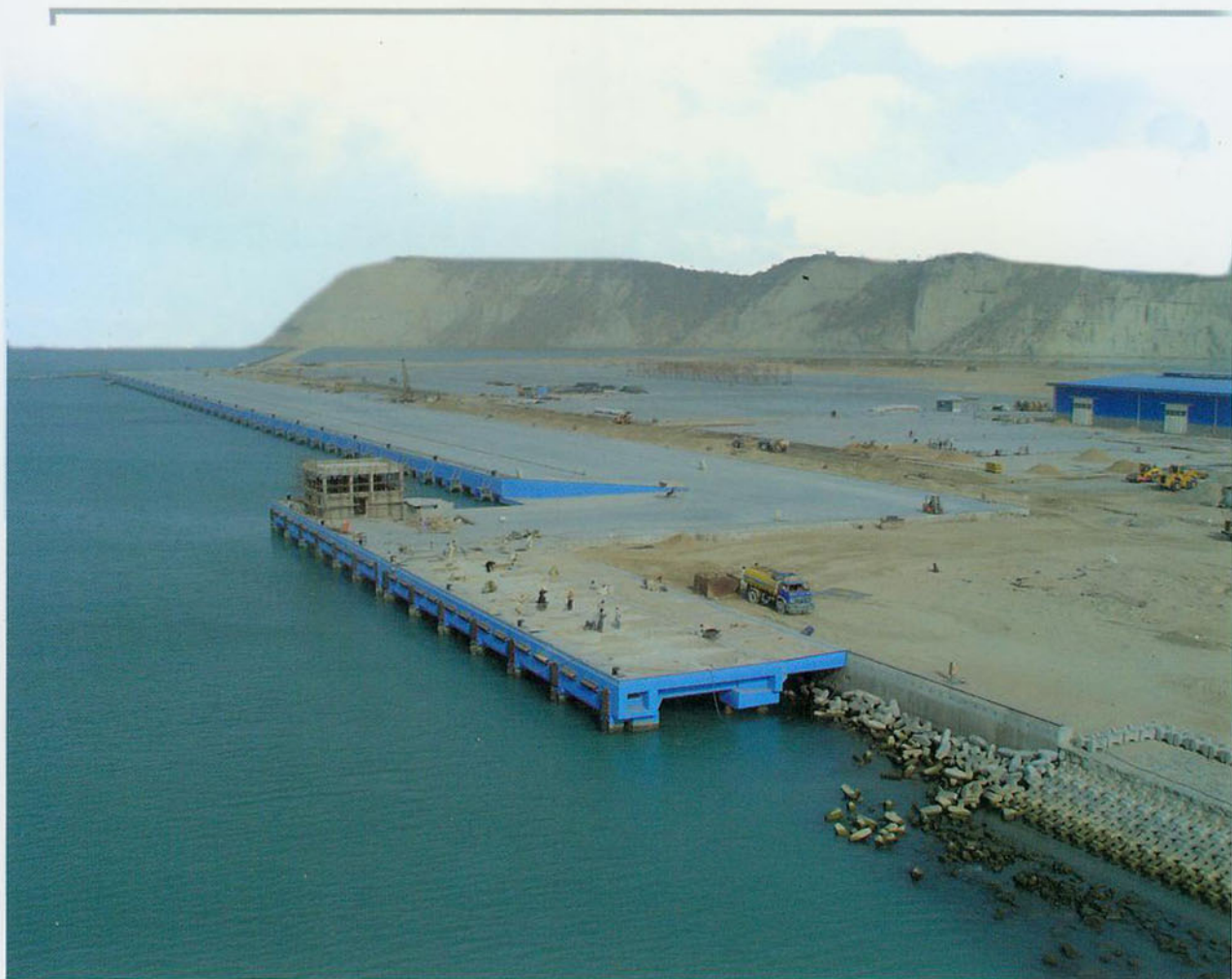
巴基斯坦瓜达尔港口项目一期水工码头工程