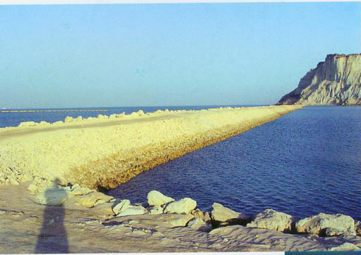
◀ 东护岸堤后二片石理坡