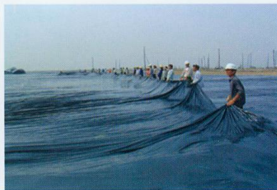
▲ 南沙港区软基处理工程- 铺设真空膜