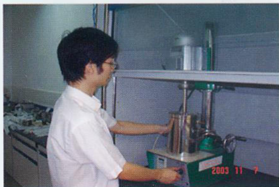
▼ 高分子材料实验室