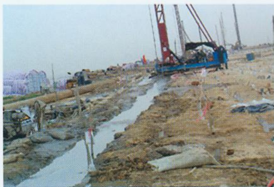
▼ 南沙港区软基处理工程- 泥浆搅拌桩施工