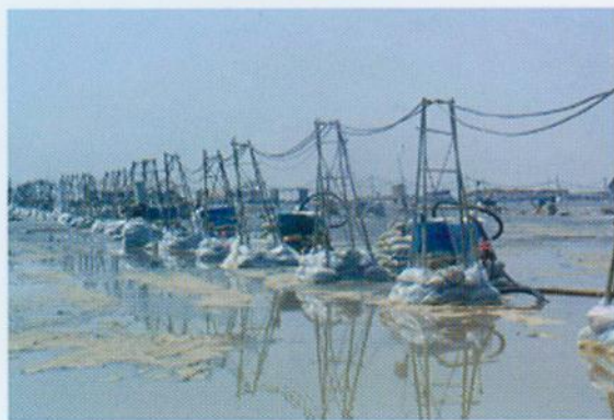
▼ 南沙港区软基处理工程- 真空预压施工