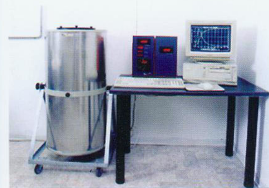
▲ 混凝土水化热测定仪