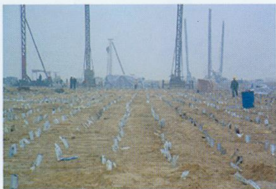
▲ 南沙港区软基处理工程- 塑料排水板施工