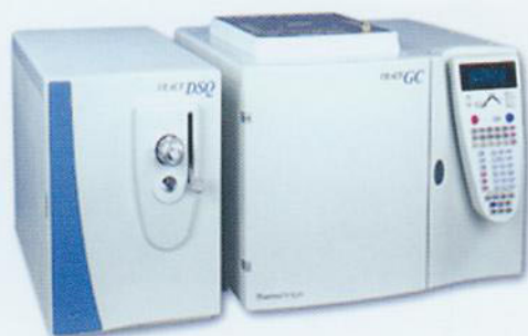
▼ 气相色谱-质谱联用仪