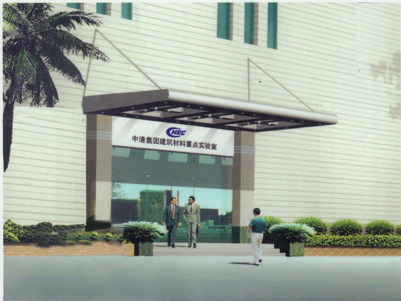
中港集团建筑材料重点实验室