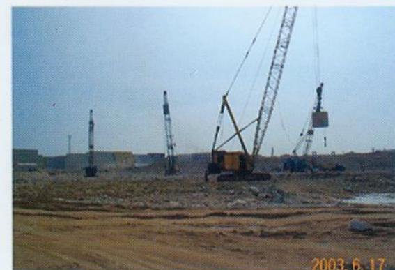
▲ 蛇口集装箱码头二期工程 软基处理-强夯施工