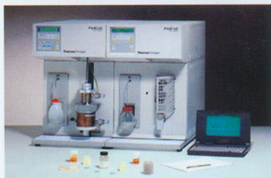
▼ 混凝土孔结构测定仪