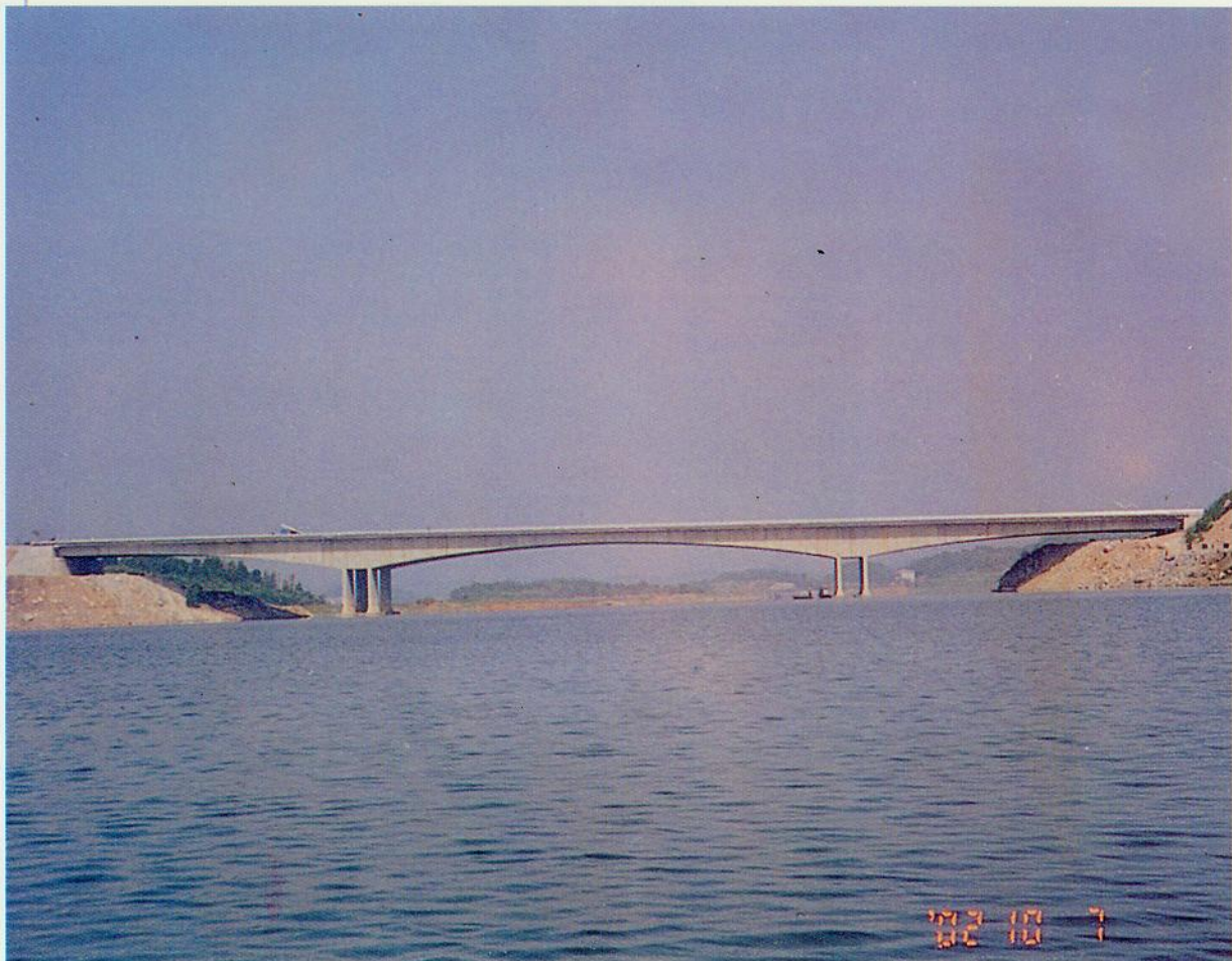
水府庙特大桥全貌