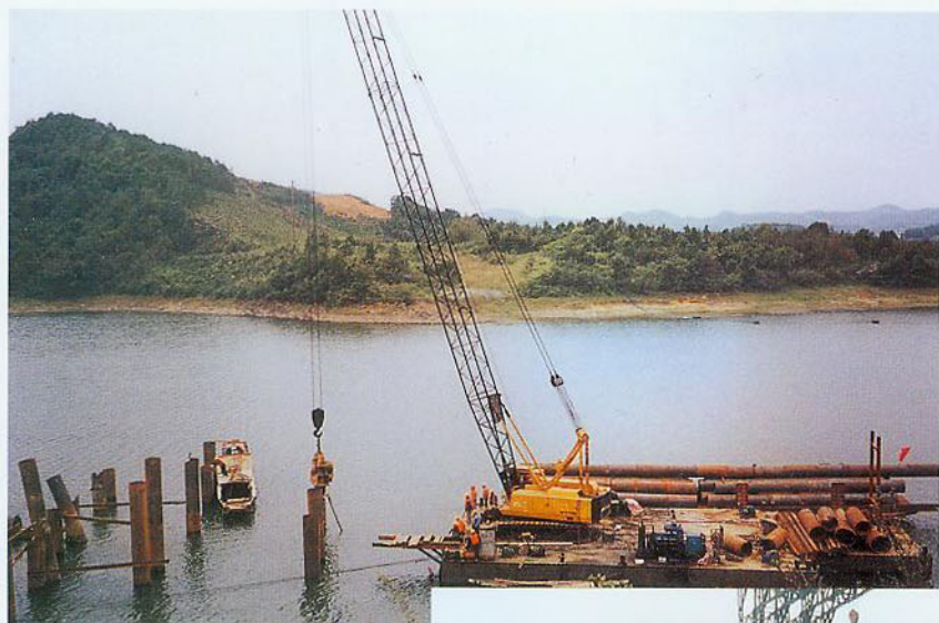
● 大桥桩基平台 施工