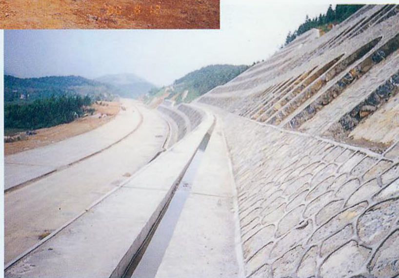
● 竣工后的路面及防护